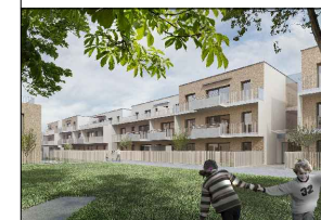
Töllergasse 3 1210 Wien