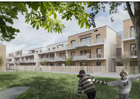
Töllergasse 3 1210 Wien