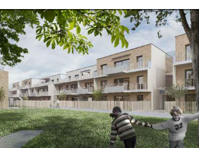
Töllergasse 3 1210 Wien